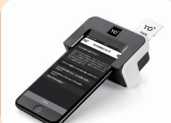
画面は、今回の計測結果に対する詳細説明