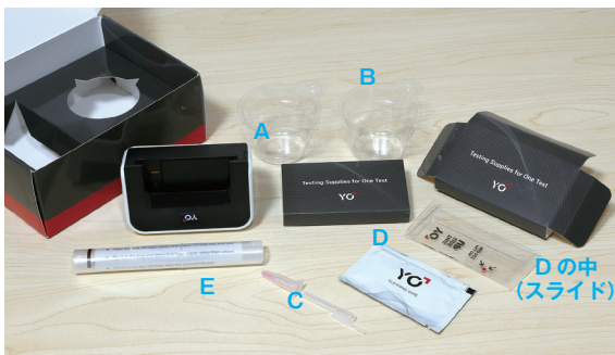
精子計測キット「YO」のセット内容。2回分の計測ができる。(説明書付)

精子検査専門で医療機器を開発してきたメーカーだからこそ、精液検査に必要な「液化」を促進させて検査時間を短縮させる「液化促進パウダー」も添付しています」