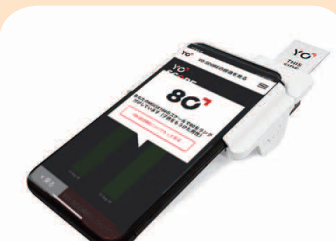
画面は、今回の計測でのYO SCORE表示