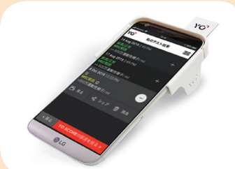
画面は、計測結果(運動精子濃度)の時系列表示