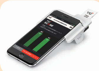
画面は、今まで計測したYO SCOREの時系列表示