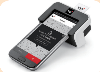
画面は、今回計測した精子のビデオ映像と表示文字